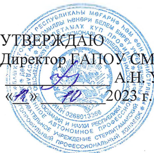
ГРАФИК ПРОМЕЖУТОЧНОЙ АТТЕСТАЦИИ

группы ПД-38 специальность 40.02.02 Правоохранительная деятельность